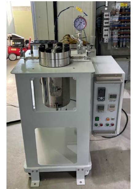
<장비 예시 사진>