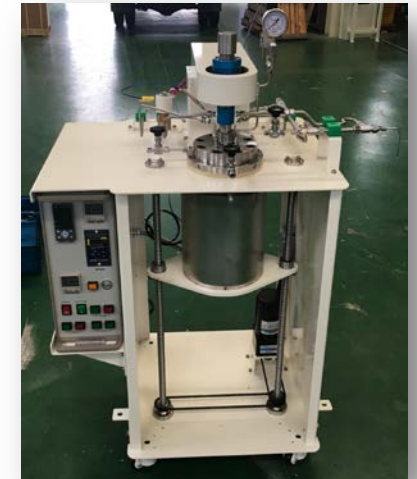
<장비 예시 사진>